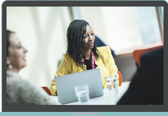
Gestão de Ordens de Compra