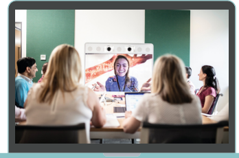
CSP Training Deck