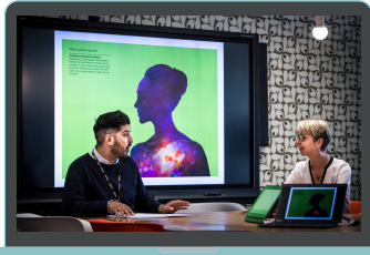
AZ Coupa Supplier Hub

Para ajudá-lo a começar a negociar com a AstraZeneca via Coupa com o pé direito, criamos para você vários recursos de treinamento. Eles fornecerão uma visão geral do que o Portal do Fornecedor Coupa (CSP) tem a oferecer aos fornecedores.